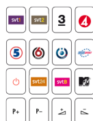
Ex. symboler, bilder, text till överlägg Klisteretiketter Falck 5716