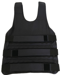
Somna Kjedevest Balance