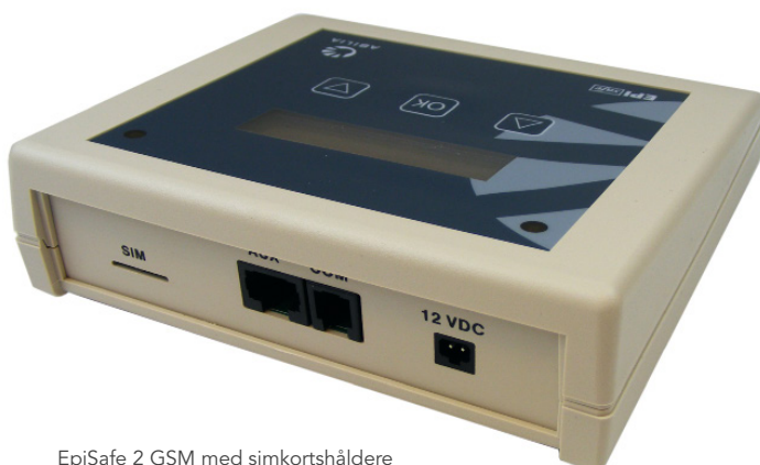
EpiSafe 2 GSM med simkortshåldere

EpiSafe passer både for voksne og for barn fra ca 10 år eller 40kg.