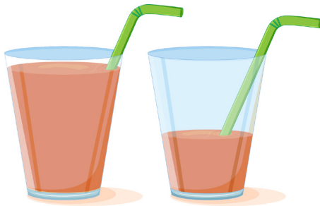
Mycket eller lite saft