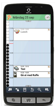
Kalendervyn med tidpelare

Du kan koppla en checklista till dina aktiviteter, till exempel vad du ska ta med till skolan eller träningen så att du kan vara säker på att du inte glömt något. Du kan också göra dina aktiviteter kvitterbara, vilket blir ett minnesstöd för dig, men även en trygghet för både dig och dina anhöriga som kan se om dina aktiviteter genomfördes.